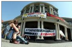
Hamburger Warnstreik gegen Gebühren (2006): Harter Kurs der Uni und des Senats

"Sie muss raus, sie muss raus, sie muss raus, sie muss gehn" - singen die Fantastischen Vier in ihrem Lied "Raus". "Sie müssen raus, sie müssen gehn", heißt es im Moment auch an der Uni Hamburg. Dort werden 1110 Studenten exmatrikuliert, weil sie die Studiengebühren in Höhe von 500 Euro für das Sommersemester nicht gezahlt haben.