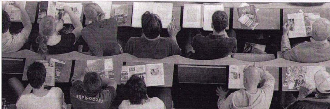
Drei Plätze sind frei – hier könnten weitere Abiturienten sitzen. Doch mehr junge Menschen als bisher vermutet schrecken vor einem Studium zurück. Hauptgrund: die Studiengebühren.

An der Uni Hohenheim haben Wissenschaftler einen „Gebührenkompass“ eingerichtet. Damit wird untersucht, wie 54 Universitäten im gesamten Bundesgebiet die neuen Beiträge verwenden und ob sich tatsächlich die Studienbedingungen dadurch verbessern. Das Urteil der Zahler fiel vernichtend aus: 70 Prozent sind für die sofortige Abschaffung der Gebühren nach dem Vorbild Hessens, meldet die „Zeit“ unter Berufung auf die Studie.